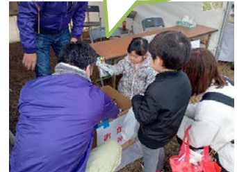
お菓子のつかみどり♪